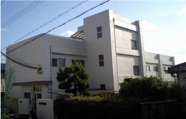
(平成28年7月寮外壁改修工事実施)