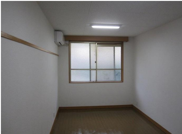
(平成26年3月寮生個室改修工事実施)